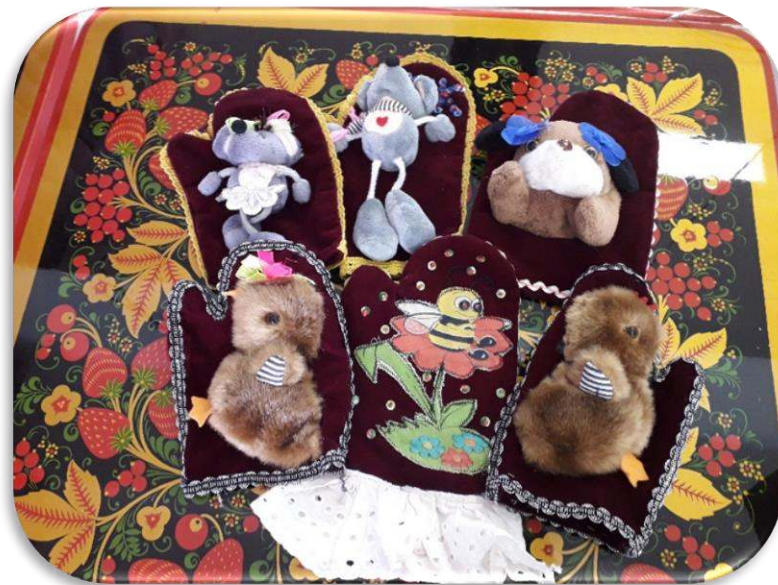
Театр на варежках