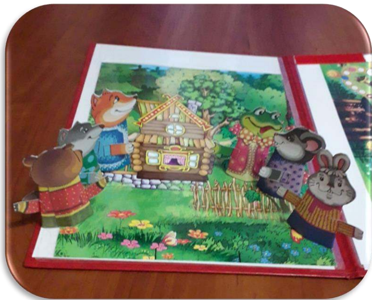
Пальчиковый театр «Теремок»