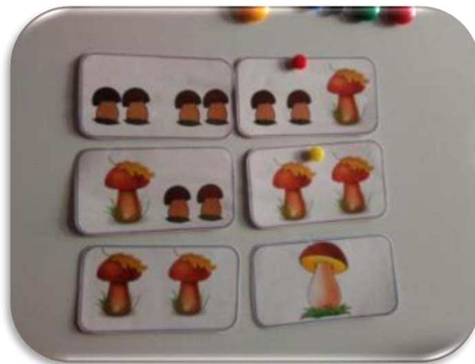
«Ножки и ладошки»